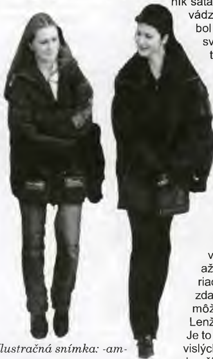
Ilustračná snímka: -am-