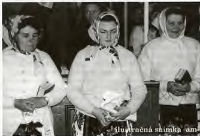
ilustračná snímka

život sa totiž zvečniť nedá, zrno musí odumrieť, aby prinieslo bohatú úrodu skutočného večného života. A týmto zrnom bol predovšetkým ako "prvotina" Kristus, ktorý svojím odumretím a zmŕtvychvstaním sa stal jediným vykupiteľom všetkých