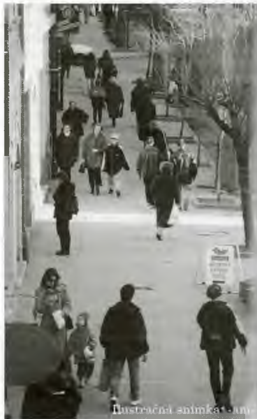
Ilustrácia: Aniketa - un