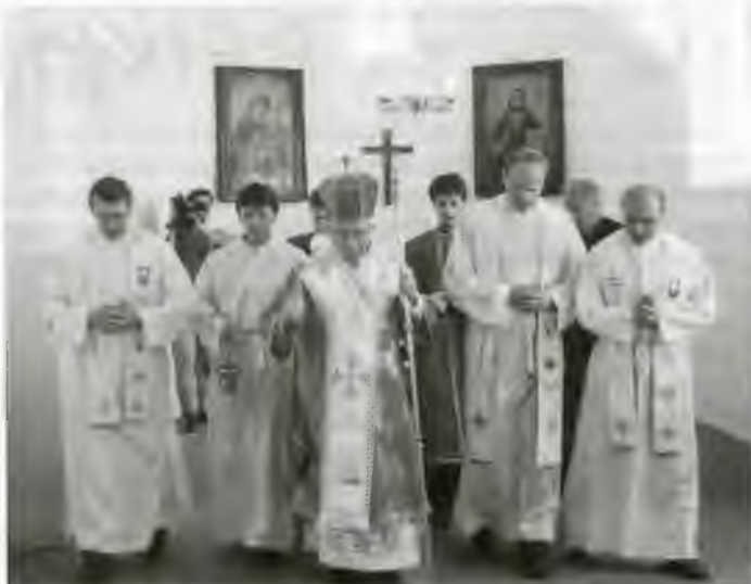
Posviacka obnovenej kaplnky vo vojenskom výcvikovom priestore v Kamenici nad Cirochou.

- Podľa Konceptie o zavedení DNS do armády SR a predpisov z nej vyplývajúcich 30 miest má byť obsadených katolíckymi duchovnými. Nerozlišuje sa medzi rímskokatolíckym a gréckokatolíckym kňazom. Je potrebné splniť podmienky: vek, odslužená základná vojenská služba, dobrý zdravotný stav, pastoračná prax, odporúčanie biskupa a podmienky pre prijatie vyplývajúce z vojenských predpisov. Tofko teória. Prax