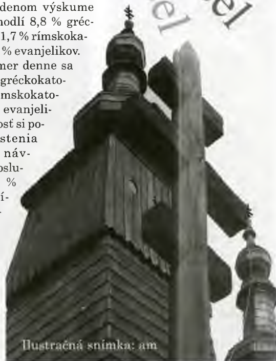
Ilustračná snímka: am