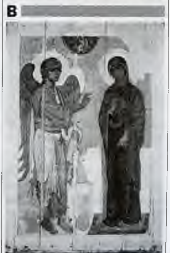
Spravena odpoveď: 1B, 2A.