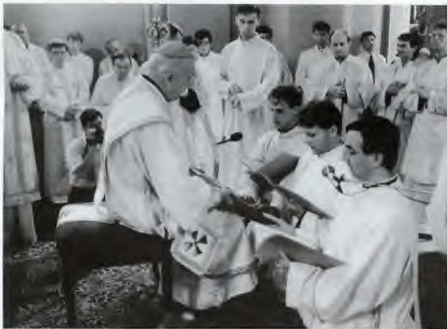
Sníмка - am -

19,25-27: A od tej hodiny si ju učeník vzal k sebe.