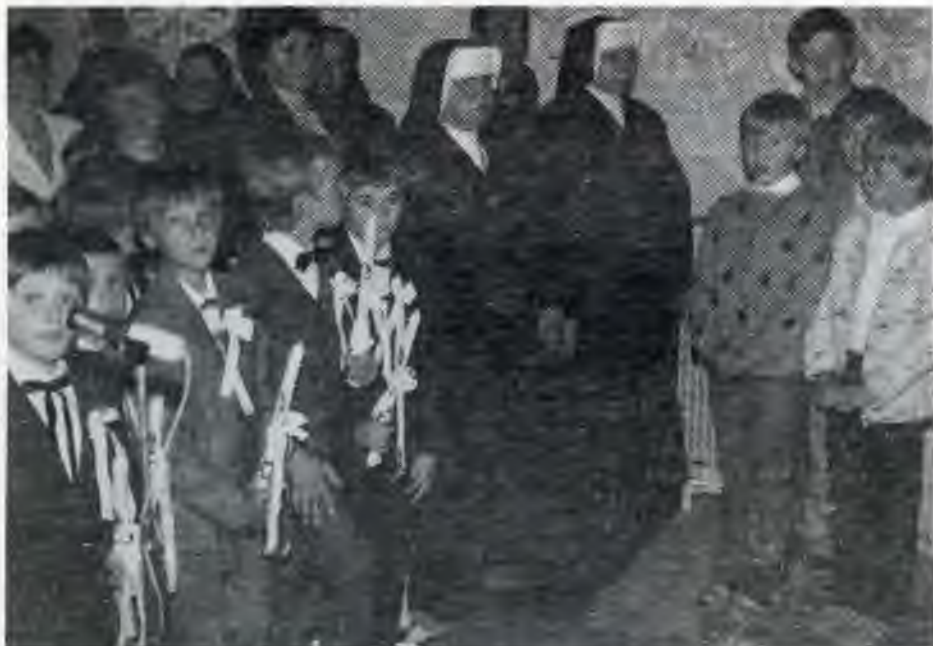
Prvé sv. prijímanie v Rakovci nad Ondavou