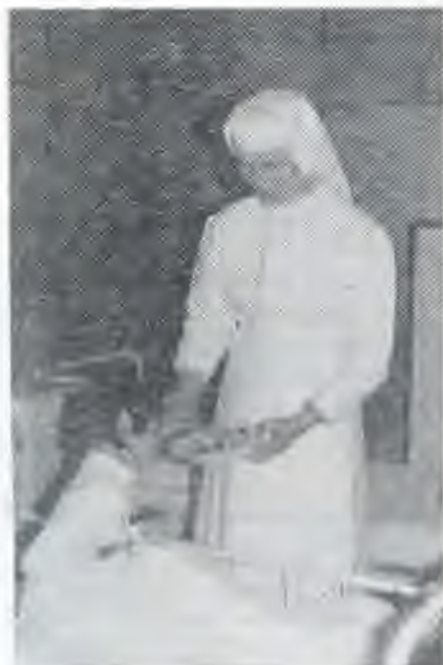
Sestra pri práci — Rakovec nad Ondavou

Zamestnanci ich prijali veľmi chladne, Nepodali im ani ruku. Len vedúca ich zaviedla do pripravenej izby, ktorá im slúžila na všetko. Dôveru u zamestnancov sme sa snažili získať svedomitou prácou, dobrými vzťahmi, ručnými prácami, ktoré