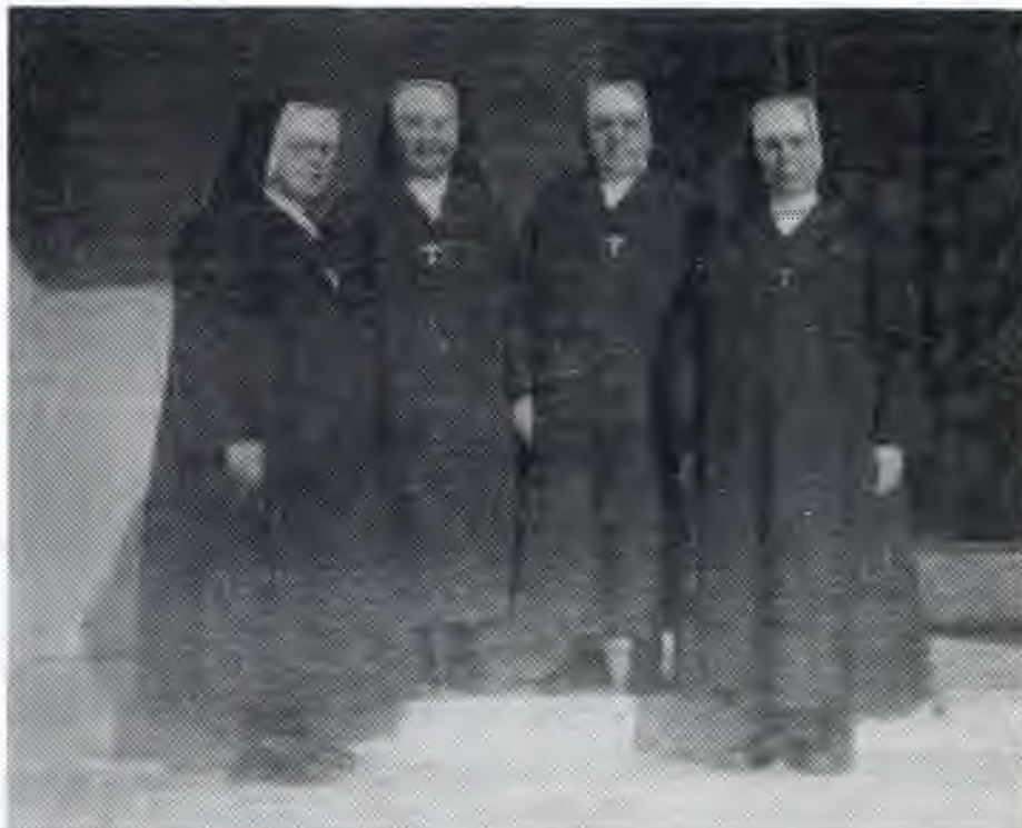
Sestry v Rakovci nad Ondavou

sme robili s chovankami. Ručné práce, ktoré sme robili, dali sme neraz aj zamestnancom, čím sa k nám začali chovať ľudsky a priateľsky.