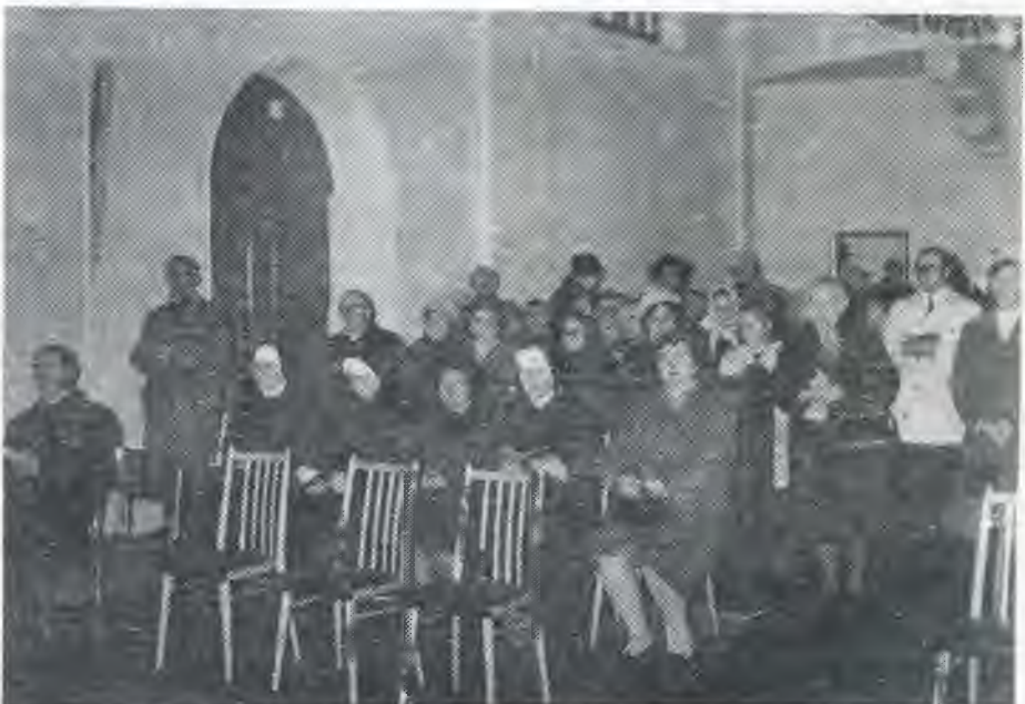
Na posviacke chrámu v Bratislave r. 1971