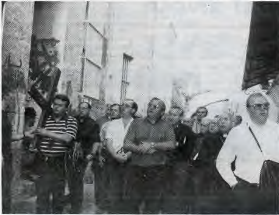
Účastníci zázjazu na krížovej ceste