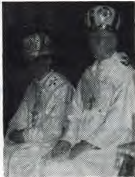
stala okamihom našej jednoty s Kristom uprostred nás.

Zabudnime a odložme teraz všetky svoje starosti a trápenia a prežime naplno chvíle v jednote s Bohom a medzi nami tak, aby sa táto slávnosť