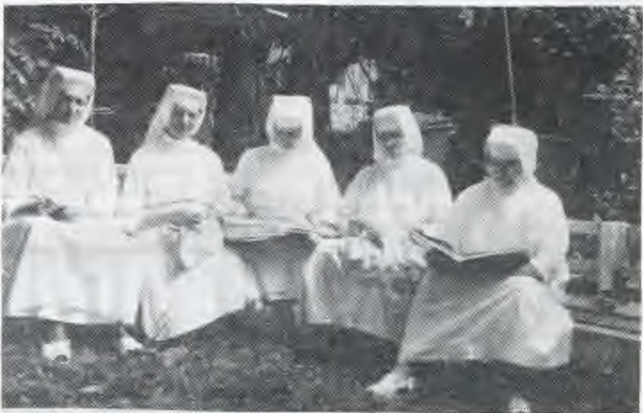
Sestry počas duchovného čítania