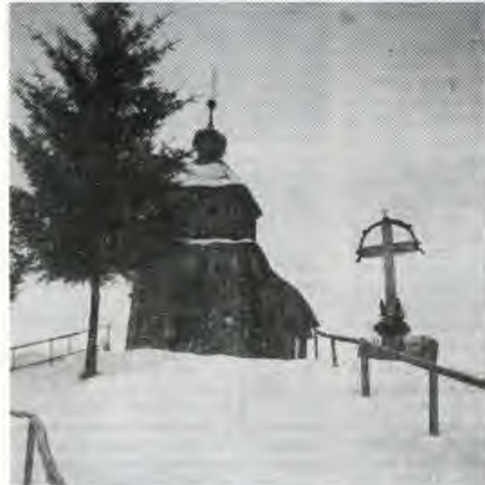
Pôsobiak nového otca biskupa si pripomínáme i pohľadom na cerkev v Šmigovci.

Nech táto milá slávnosť v našich srdciach nezostane len poďakovaním za túto veľkú milosť, ale aj začiatkom ozajstného kresťanského života. Opäť sa potvrdila stará známa pravda, že Boh dopúšťa, ale neopúšťa. A on neopustí svojich ani v budúcnosti, čo nám naznačil aj prostredníctvom nového otca biskupa slovami z križa: Hľa, tvoja Matka.