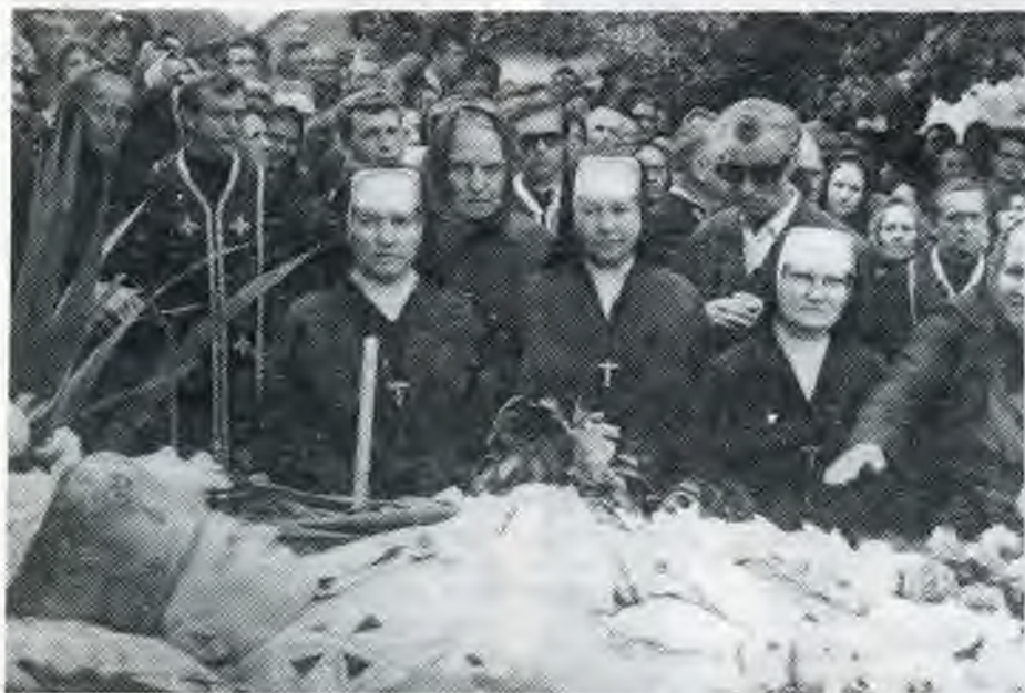
Na pohrebe otca biskupa ThDr. Vasila Hopka v Prešove