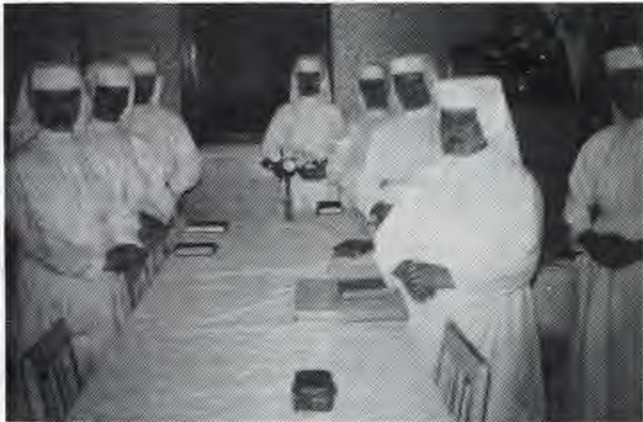
Sestry pri duchovnej prednáške

Do neba vedie úzka cesta a tesná brána. Kristus nám ponúka aj prostriedok, ako sa tam bezpečne dostať — je to kríž. Bojíme sa ho, ale všetci vieme, kam vedie široká cesta . . . !