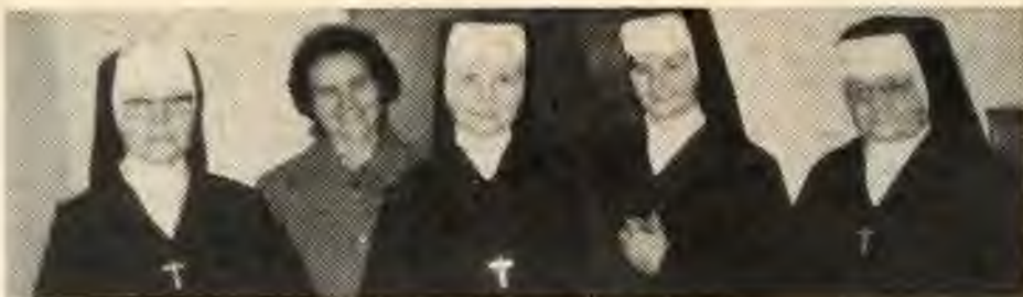
Posledné štyri sestry v Kolešoviciach v roku 1989