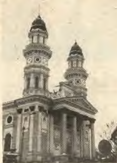
Gréckokatolícka katedrála Povýšenie sv. Kríža v Užhorode.

■ Koncom roka 1991 sa uskutočnila vo Vatikáne porada všetkých nunciou a apoštolských delegátov z Blízkeho východu. Okrem štátneho sekretára kardinála Angela Sod'ana a Jeana-Marie Taurana, ktorý je vatikánskym „ministrom zahraničia“, sa porady zúčastnil aj prefekt kongregácie pre východné cirkvi kardinál Achille Silvestrini. Vatikán sa usiluje, aby sa spojenia s kresťanskými cirkvami na Východe utužili a aby katolíci nezabudli na krajinu, v ktorej je pôvod ich viery.