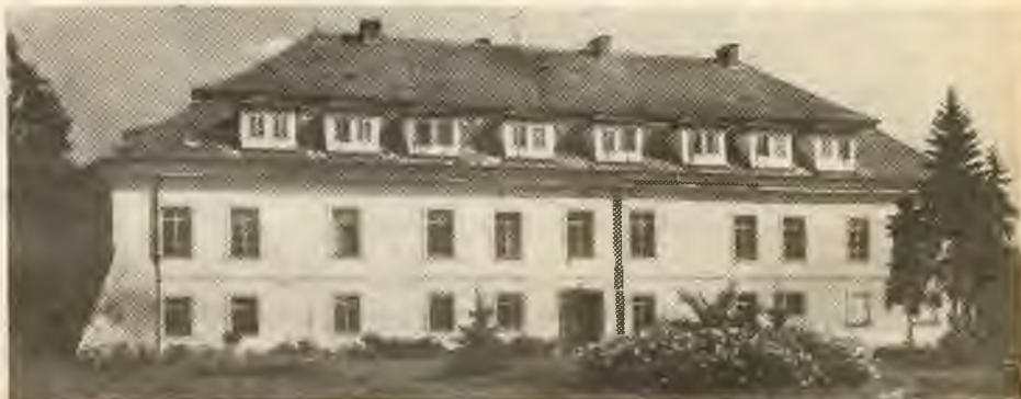
Dom dôchodcov v Kolešoviciach