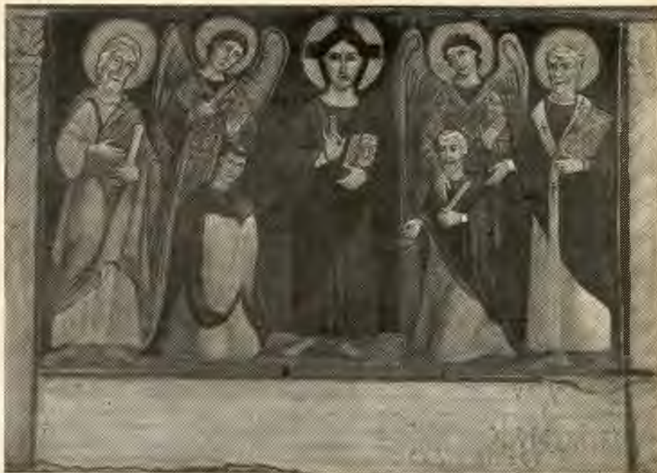
Dvaja anjeli so sv. Andrejom a Klementom predstavujú kľačiaceho Cyrila Kristovi. Kópia fresky z 11. storočia v bazilike sv. Klementa v Ríme.

Životný údel Svätopluka a Wichinga tiež neskončil slávne. V roku 892 sa Svätopluk zaplietol do tuhých bojov s nemeckým kráľom Arnulfom, čo zapríčinilo, že v r. 893 musel biskup Wiching opustiť Slovensko. Stal sa Arnulfovým kancelárom a v roku 894 biskupom v Pasove, ale už v roku 899 ho soľnohradský arcibiskup zosadil. Takto neslávne skončil nepriateľ sv. bratov.