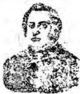
Pod obrazom o. A. Duchnovič.

Pod hory, and hrobozi. Vernyj vter predvali. Solovej sas bromkni hiasnu. Novuju pišu zaspival. Spival Rusianu svobodu. Luhov, prányj boľasov: "Ja Rusin byl, jesti i budu. Je rodilija Rusianom!"